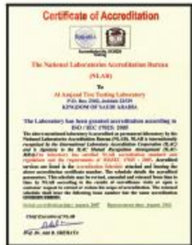
Certification of Accreditation The National Laboratories Accreditation Bureau (NLAB) Certification No. 013/029

مختبر الأمجاد لفحص الإطارات مسجل و معتمد من قبل هيئات محلية و عالمية في إختيار أداء الإطارات و إختيار المواد المصنعة منها الإطار و إختبارات المتانة و المقاسات و خصائص الإطارات . مرخص من وزارة التجارة و الصناعة ، المملكة العربية السعودية . حاصل على شهادة اللجنة السعودية للإعتماد