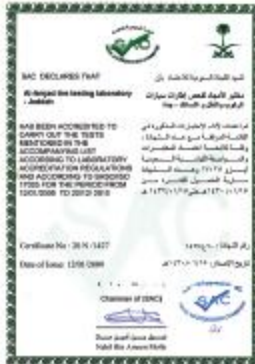
Saudi Accreditation Committee (SAC) Certification No. 20N/1427