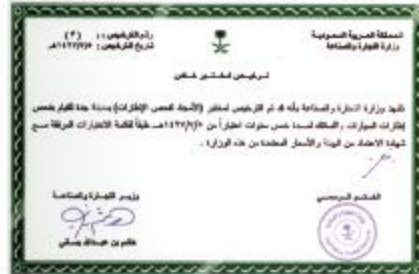
Saudi Arabian Ministry of Commerce and Industry License of Testing Laboratory